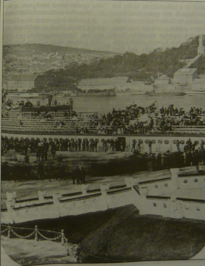
Disztribúció a Duna-parton a koronázáskor 1867. június 8.

legalábbis a földet ténylegesen beküldő helyhatóságok ezeket a kategóriákba tartoztak. Létszámuk ekkor 100-150 körül járt. Az akcióban a döntő szerepet azonban a korszak — a politikai gondolkodást is befolyásoló — historizáló szemlélete, mentalitása játszotta. A koronázási domb ilyenét összetétele alkalmas volt arra, hogy kifejezze az állam hatalmának a koronázás aktusában láthatóvá vált egységét és kiterjedését az egész (Mohács óta a legteljesebb) magyar államterületre, az állam egész földjére. Ugyanakkor kifejezte a teljes magyar történelem összegződését is a Szent Korona mint a nemzeti múltat a jelennek „összekapcsoló szimbólum” alatt. A tömegek számára is közérthetően legitímálta a polgári államot és a mögötte álló kiegyezést, történeti előzményeinek, gyökereinek kimutatásával. Az aktus szerepét és jelentőségét csak fokozta, hogy a beküldött ládák felbontása